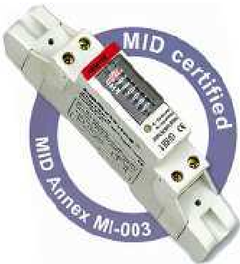
CPT KWH MONO ADM1TE MID Ref : 031049